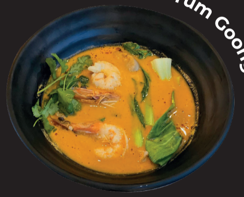
Tom Yum Goong