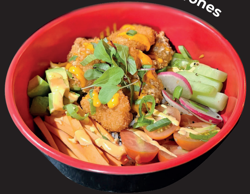
poke de Camarones

Trozos de atún marinado crudo o cocido, aguacate, bok choy, edamame, mango, zanahoria, alga wakame, semillas de ajonjolí, salsa spicy soya.